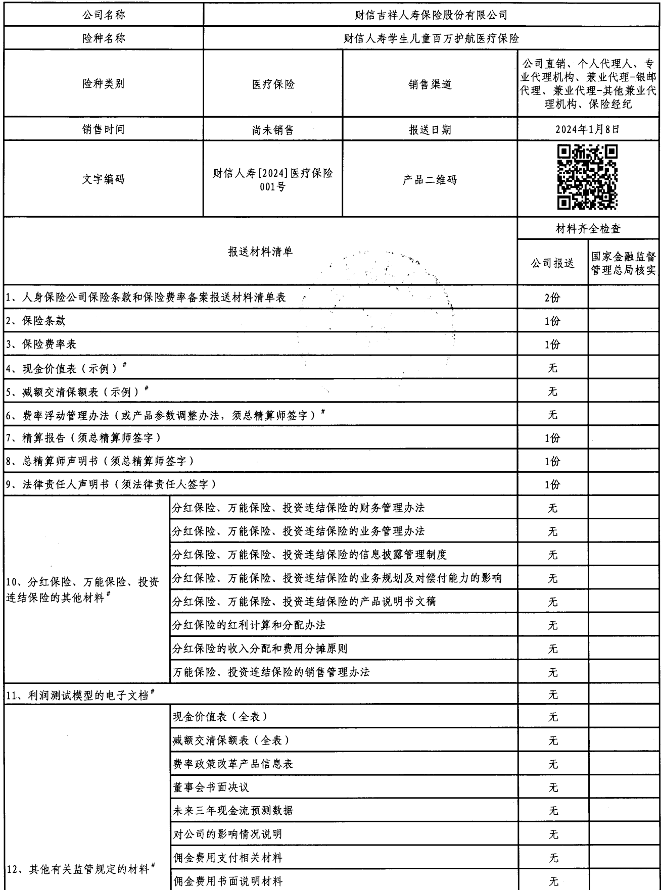
人身保险公司保险条款和保险费率备案报送材料清单表